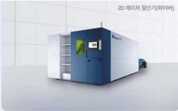
2D 레이저 절단기(파이버)