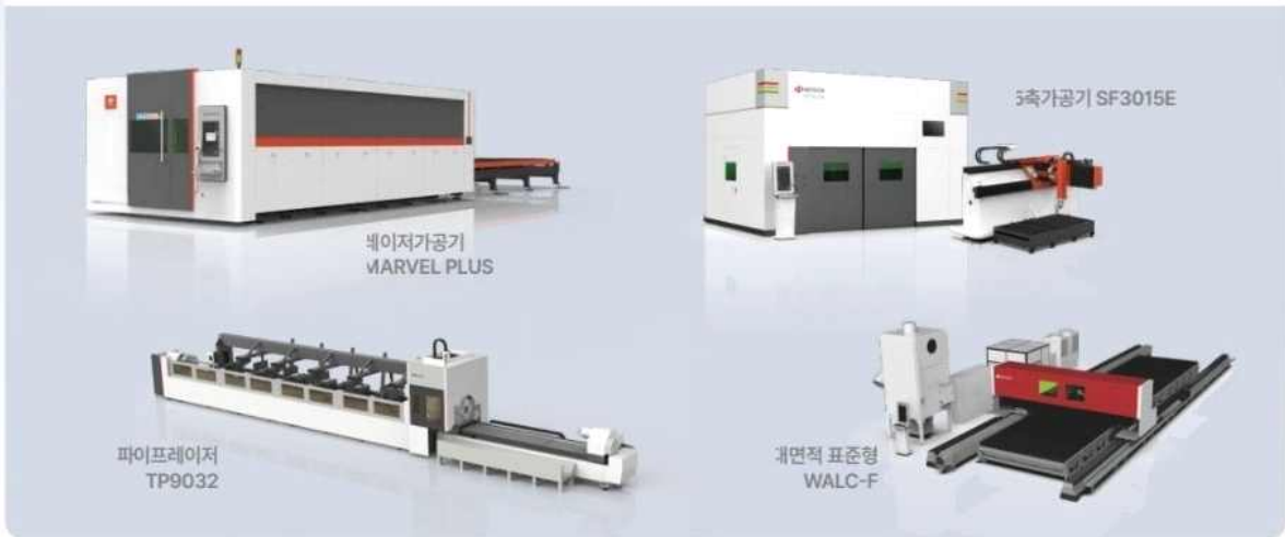
레이저가공기 MARVEL PLUS